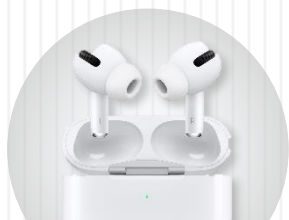
Apple AirPods Pro 2